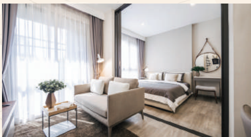
コンパクトながらも余裕のあるレイアウト