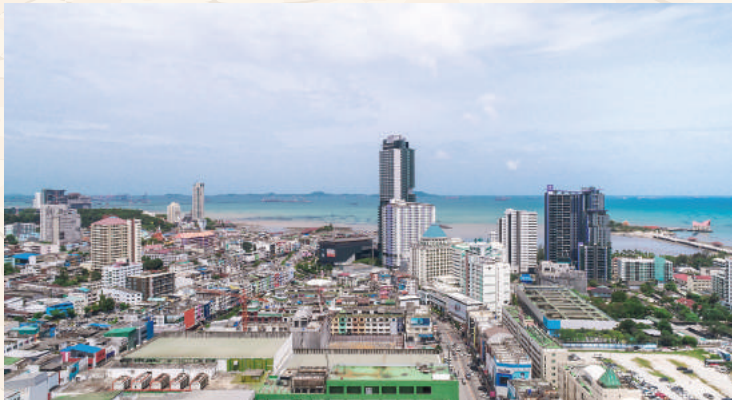
20階から見渡すシラチャの眺望