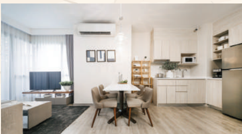
開放的なリビング