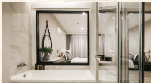
全室嬉しいバスタブ付き